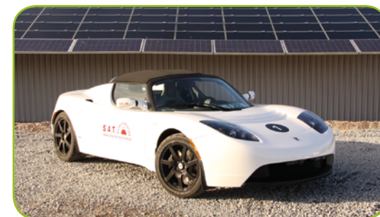
Tesla Roadster – Elektrofahrzeug